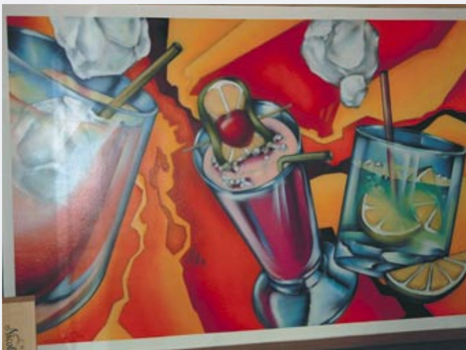
Das macht Durst: Graffiti in der Eingangshalle